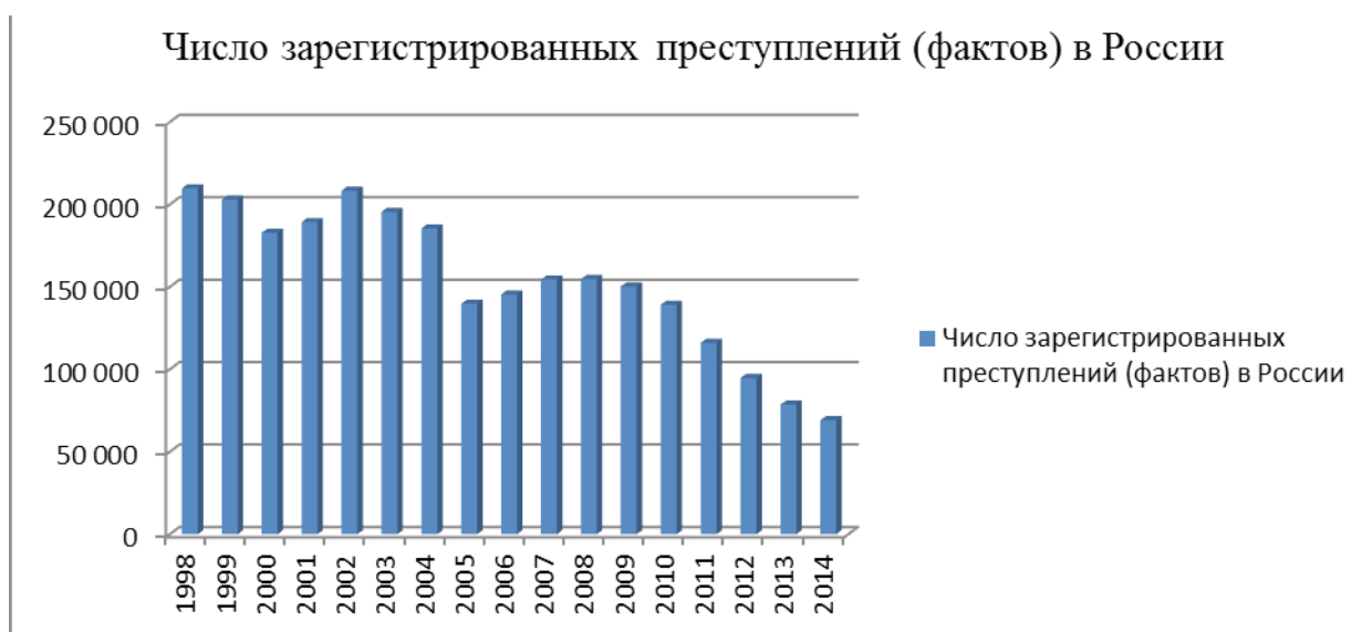
Рис. 1. Динамика преступности несовершеннолетних в Российской Федерации за 1998 – 2014 г.

сти, повышению эффективности использования имеющихся сил и средств по противодействию преступности. Одним из приоритетных направлений являлось противодействие преступности несовершеннолетних.